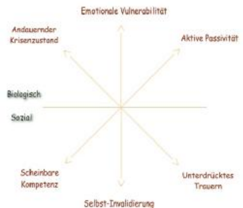
Abb. 3 Marsha Lineham, 1996, S.51

Die Betroffenen bewegen sich jeweils an den Polen und können keine ausgewogene Position finden (siehe Abb. 3).