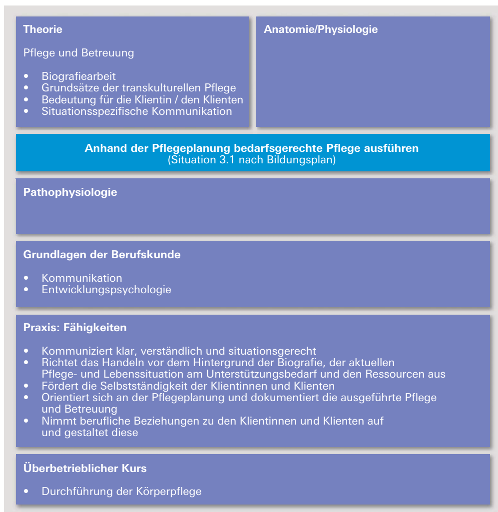
Abb. 1 Überblick über die Zusammenhänge